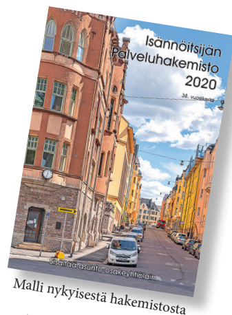
Malli nykyisestä hakemistosta

Uutuutena hakemisto julkaistaan nyt myös digitaalisesti näköisversiona nettisivuillamme sekä interaktiivisena digiversiiona, jolloin asiakas pääsee klikkaamalla suoraan nettisivuille, sähköpostiin tai puhelinnumeroon.